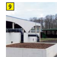
9 Biofilter Reinigung der Anlagenluft