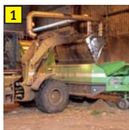
1 Abfallaufgabe Beladung des mobilen Zerkleinerers