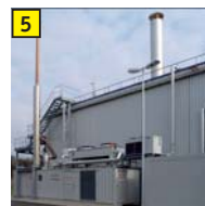
5 Blockheizkraftwerk und Fermenter mit Notfackel Verstromung von Biogas mit Wärmenutzung