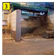
3 Sternsieb Materialtrennung in Grob- und Feinfraktion