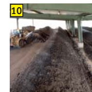
10 Nachreife Ausreife des Komposts in offener Halle