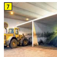
7 Konditionierung Belüftung des Gärguts und Vermischung mit Grünschnitt