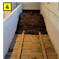
4 Beschickungsbunker Aufgabe des Feinmaterials für den Fermenter