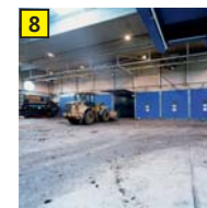
8 Rottentunnel Intensivrotte und Kompostierung