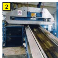
2 Metallabscheider Abtrennung von eisenhaltigen Metallen