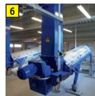
6 Schneckenpressen Entwässerung des Gärrestes